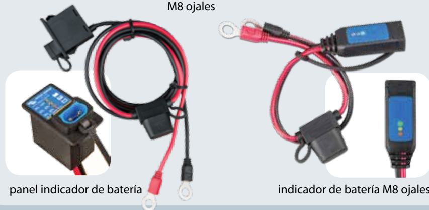
panel indicador de batería