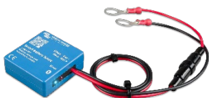
Sensor Bluetooth: Smart Battery Sense