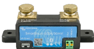
Sensor Bluetooth: SmartShunt