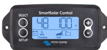
Pantalla enchufable SmartSolar