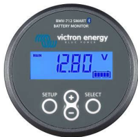
Sensor Bluetooth: Monitor de baterías BMV-712 Smart