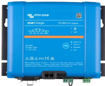
Cargador Smart IP43 12/50(1+1)