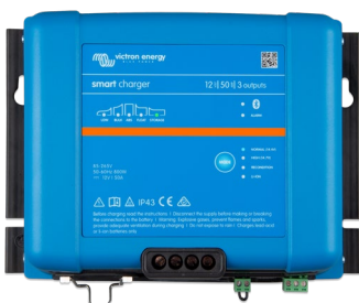
Cargador Smart IP43 12/50(3)