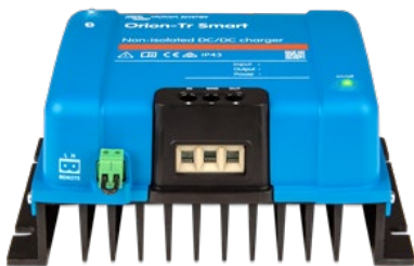
Orion-Tr Smart no aislado 12/12-30