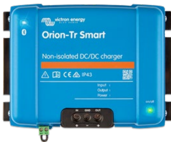
Orion-Tr Smart no aislado 12/12-30