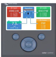
Color Control GX